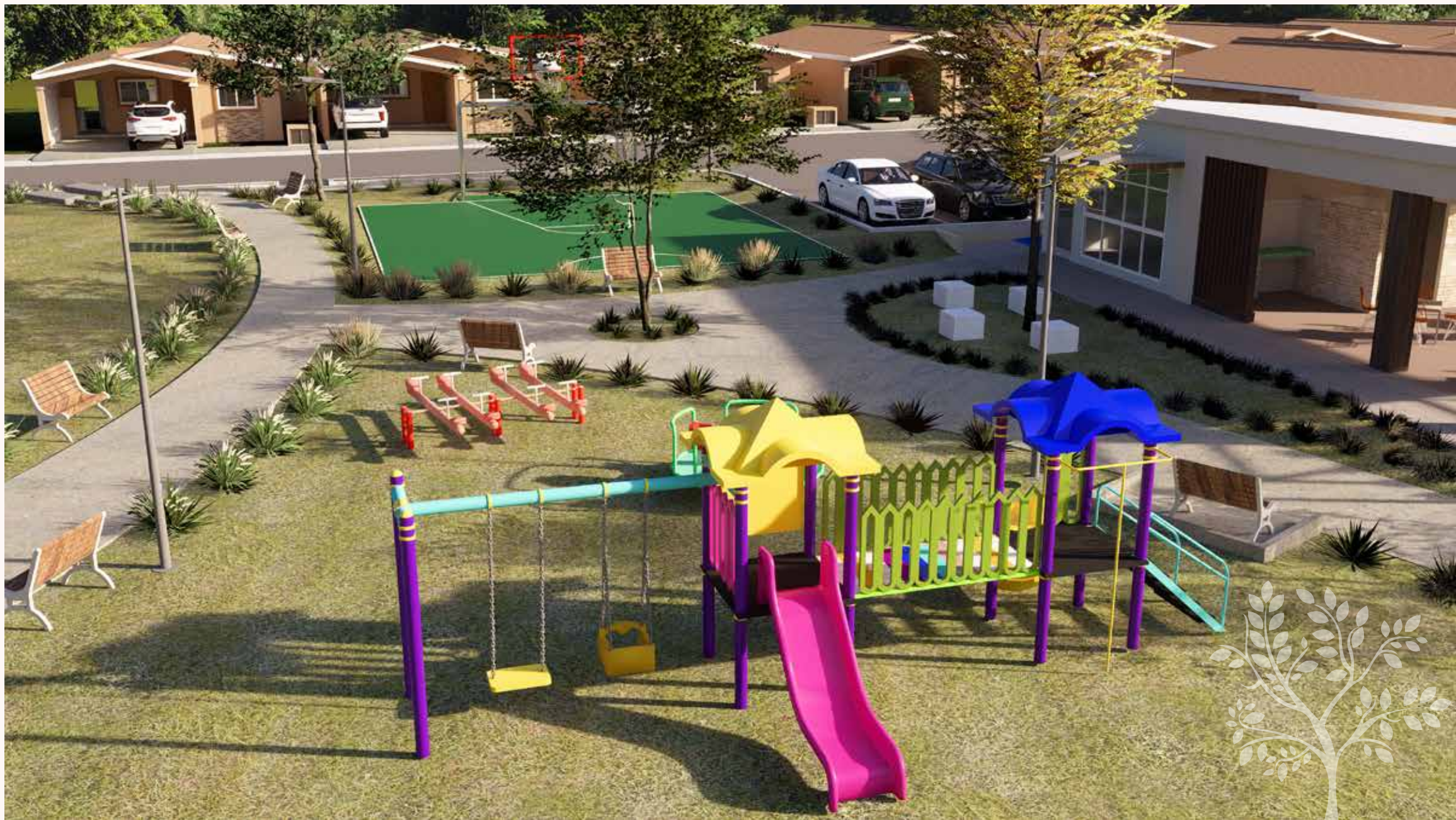
PARQUES CON JUEGOS INFANTILES Y ÁREAS VERDES